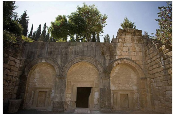
מקרת הארנות, בית שערים