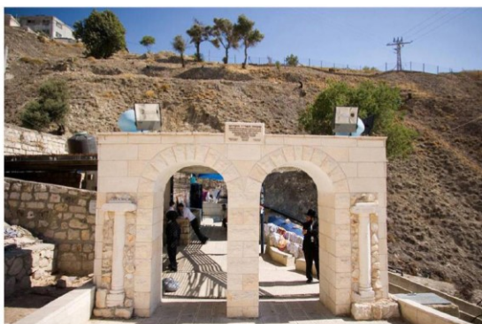
מקווה האר"י, צפת