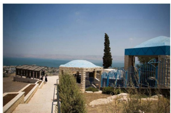
קבר הרמב"ם, טבריה