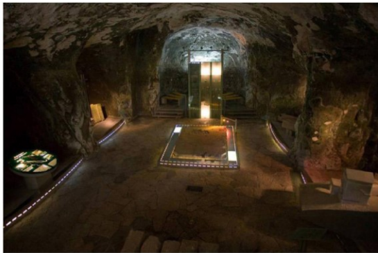
מאוזליאום, בית שערים